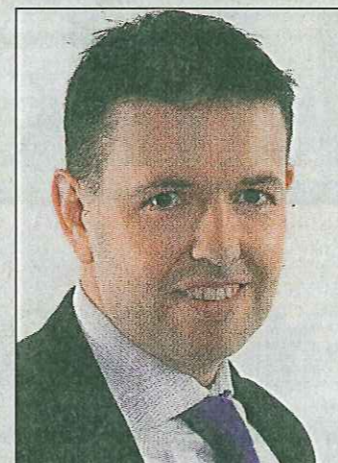
• Advocaat Kabel ...dwingen...

grote pupillen heeft nadat hij slingerend van de weg is ge-