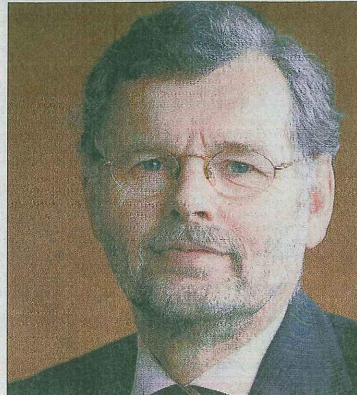
• SWOV-directeur Wegman ...serieus risico...

Dat veruit de meeste automobilisten die drugs gebrui-